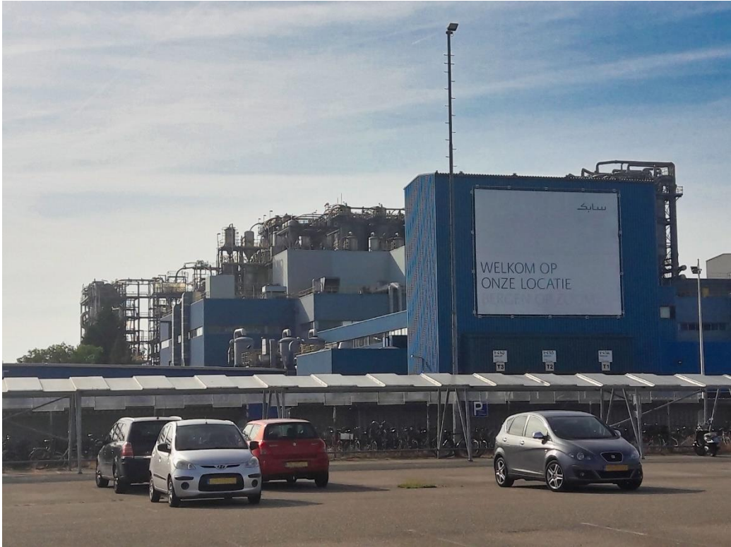
Het perspectief van een bewoner