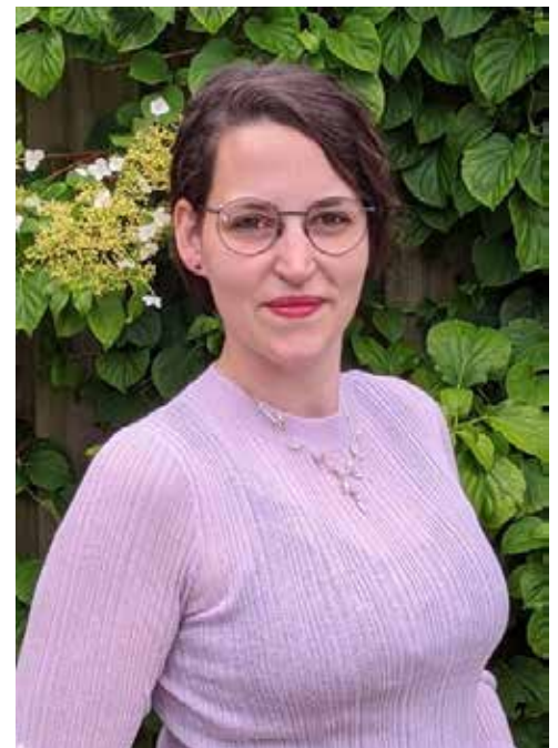
De leden van het bestuur